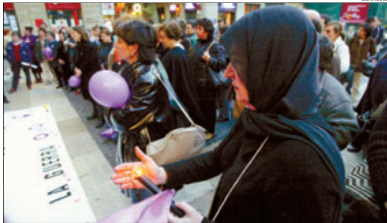
▶ Mujeres de luto portan velas negras, ayer, en la concentración de la plaza de Sant Jaume contra la guerra.